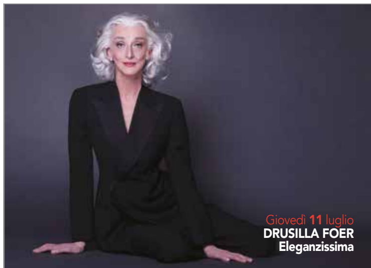
Giovedì 11 luglio DRUSILLA FOER Eleganzissima