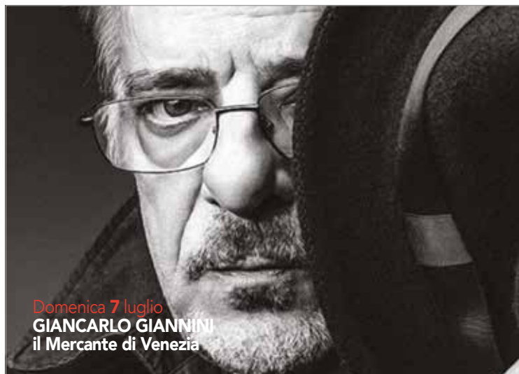
Domenica 7 luglio GIANCARLO GIANNINI il Mercante di Venezia