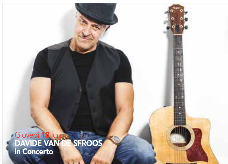
Giovedì 18 luglio DAVIDE VAN DE SFROOS in Concerto