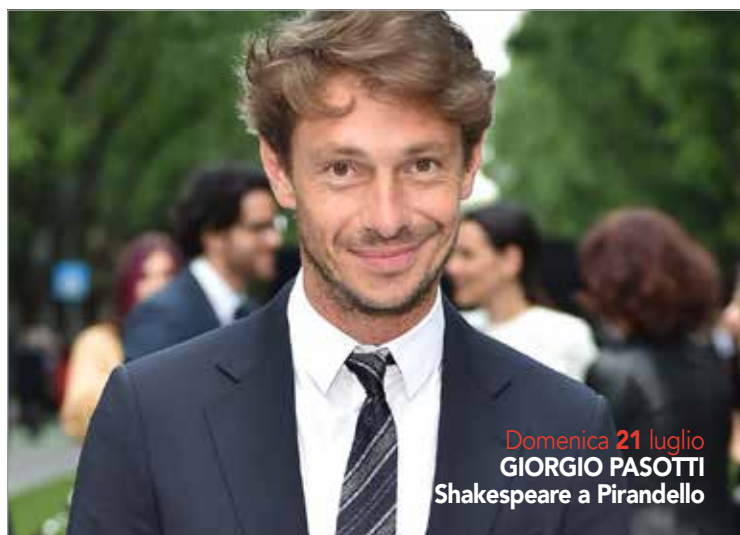
Domenica 21 luglio GIORGIO PASOTTI Shakespeare a Pirandello